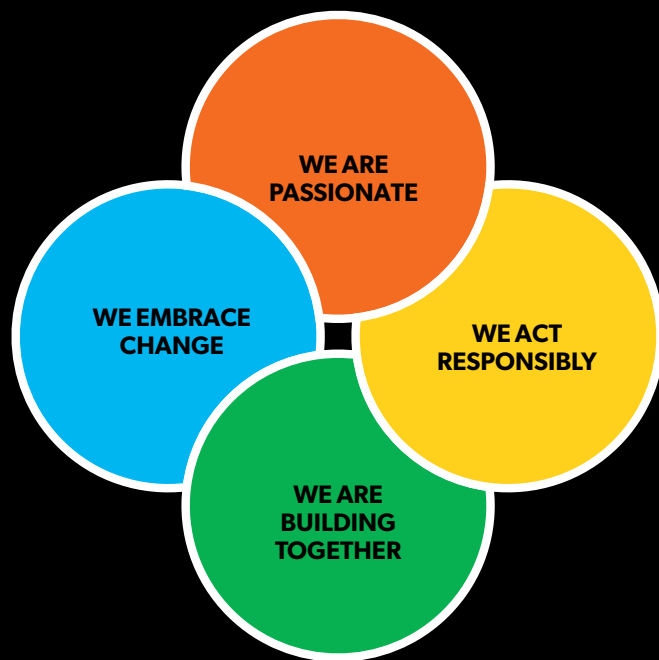
Our core values